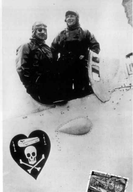
La dernière photo de Nungesser et Coli avant leur départ. En 1967, un timbre-poste a été émis pour commémorer le vol.

Partis de Paris le 8 mai 1927 pour rejoindre New-York en vue de réaliser le premier vol transatlantique sans escale, Charles Nungesser et François Coli, pionniers de l'aviation, ne sont jamais arrivés à destination.