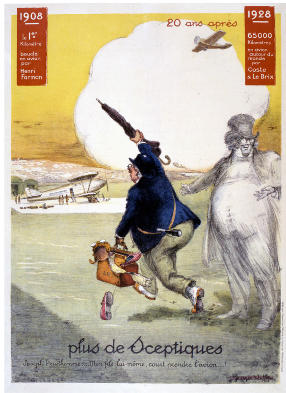
Plus de sceptiques , affiche éditée par l'exposition officielle du Salon de l'Aéronautique, 1928. - Coll. musée de l'Air et de l'Espace - Le Bourget / Georges Villa - Inv 996/46/17

Cet été, le musée de l'Air et de l'Espace invite tous les publics à découvrir l'histoire des ballons et des avions à travers le regard espiègle, humoristique ou parfois satirique, des caricaturistes. Qu'ils soient simples curieux ou amateurs éclairés, rêveurs ou fervents passionnés, les visiteurs de la nouvelle exposition temporaire « Drôles de vols - caricaturer les expériences aériennes » pourront savourer à loisir la virtuosité et la malice de grands dessinateurs tels que Cham, Daumier, Reiser, Coco, Camille Besse ou Riss.