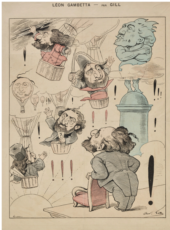
Léon Gambetta, André Gill (1840 - 1885) - Publié dans La lune rousse du 13 août 1877 - Lithographie - 60 x 47,6 cm - Musée de l'Air et de l'Espace, inv. 3927

exposition du 27 juin 2026 au 3 janvier 2027