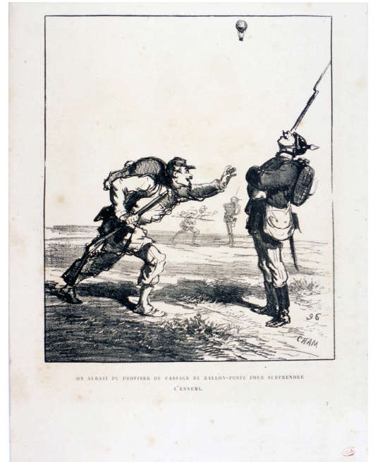
On aurait pu profiter du passage du ballon poste pour surprendre l'ennemi. Cham (1818 - 1879) - Entre 1870 et 1871 Lithographie - 31,2 x 22,3 cm - Musée de l'Air et de l'Espace, inv. 4229

Ces documents, imprimés en nombre, ont longtemps été considérés moins nobles que d'autres productions artistiques. Le support papier les rend fragiles, empêchant une exposition de longue durée. Aussi c'est de manière tout à fait inédite que le musée de l'Air et de l'Espace rassemble autant de caricatures des XVIII e et XIX e siècles dans le cadre d'une exposition temporaire. Pour ce faire, une importante campagne de restauration a été engagée depuis deux ans permettant de traiter environ 75 pièces d'arts graphiques. Les interventions ont surtout porté sur le dépoussiérage, l'atténuation de taches, le retrait de montages anciens afin de redonner aux objets une lisibilité optimale.