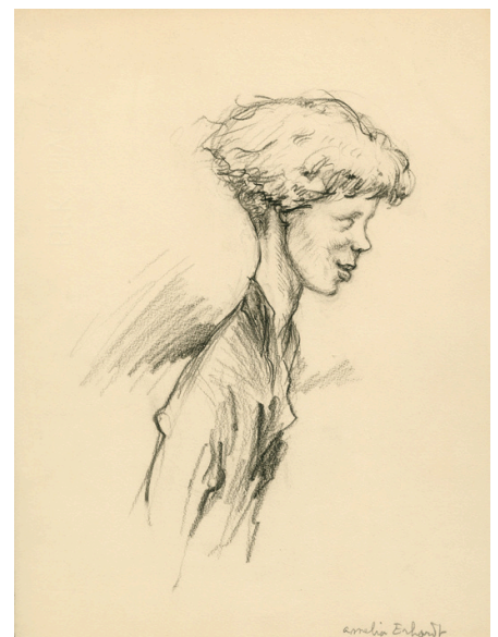
Portrait d'Amelia Earhart, dessin, vers 1928. - Coll. musée de l'Air et de l'Espace - Le Bourget / Georges Villa - Inv 2025/13/1