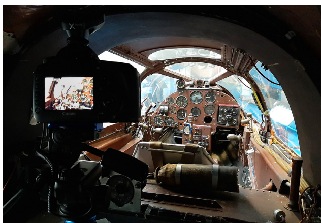
© Axel Ruhomaully Avion Hirsch H-100

La scénographie propose de mettre en regard les 55 œuvres avec d'autres objets issus des collections du musée (maquettes, bijoux, documents d'archive...) mais aussi d'entrer dans l'univers de l'artiste. Son studio photo est ainsi reconstitué, reproduisant son travail de lumière autour d'un moteur.