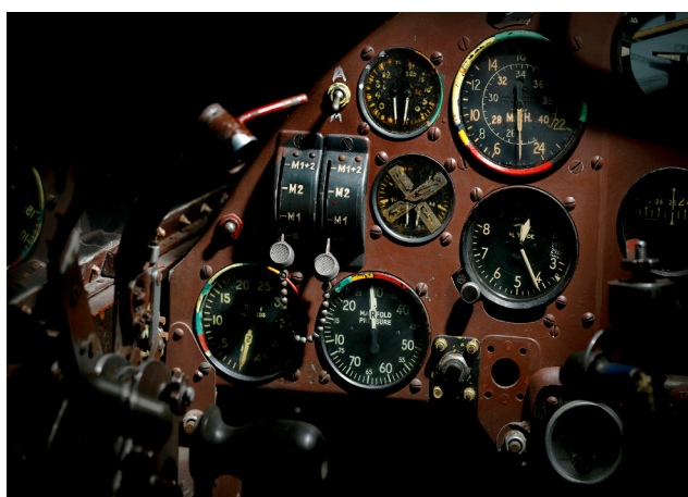
© Axel Ruhomaully Avion Hirsch H-100

Axel Ruhomaully a développé depuis plusieurs années une technique de reproduction photographique très spécifique. Comme un peintre, il pose sa base, un fond noir qu'il crée au préalable au moment de la prise de vue en sous-exposant l'image, pas de retouche numérique. Ce noir profond et intense est l'élément majeur de son univers et de sa signature. Une fois cette base posée, il construit son éclairage en sculptant l'objet avec ses flashes de studio, qu'il appelle « pochoirs de lumière ». Tels des acteurs sur une scène de théâtre, la matière sculptée se révèle sur un fond noir alors que tout ce qui n'a pas été éclairé reste dans l'obscurité. Ce jeu de lumière permet ainsi de focaliser l'attention sur le sujet principal, et d'offrir aux spectateurs une parenthèse temporelle, un moment intime avec le cliché qui y déploie toute sa puissance. Contrairement à ce que l'on pourrait croire, la plupart de ses photos sont réalisées dans des conditions d'éclairage diurne.