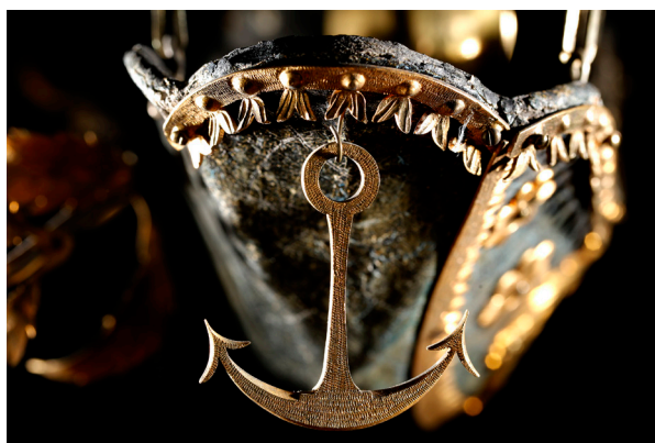
Focus