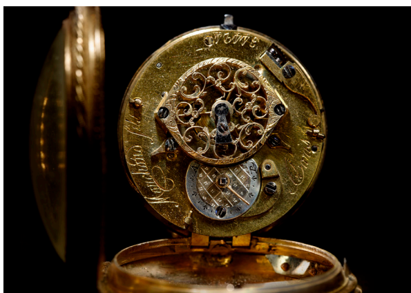
Chronicle © Axel Ruhomaully Montre en or à bélière « Marchand fils à Paris »

L'artiste-photographe Axel Ruhomaully, récemment nommé Ambassadeur de la marque Canson® Infinity, nous embarque dans des voyages qui nous rappellent les grands moments de l'Histoire grâce à des clichés uniques, réalisés dans des lieux d'exception à travers le monde. Cette année il a « installé » son studio au Bourget pour présenter aux amateurs comme aux initiés, à travers ses « pochoirs de lumière », les histoires qui se cachent derrière des pièces exceptionnelles : de l'avion de collection au mécanisme d'horlogerie, en passant par les bijoux et les avions-jouets... Une véritable envolée poétique à travers les collections permanentes du musée.