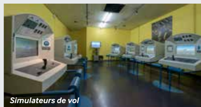
Simulateurs de vol

Démocraties fragilisées et expériences totalitaires dans l'Europe de l'entre-deux-guerres