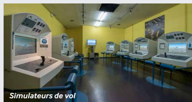
Simulateurs de vol

Démocraties fragilisées et expériences totalitaires dans l'Europe de l'entre-deux-guerres