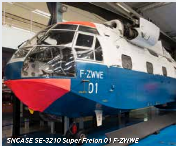
SNCASE SE-3210 Super Frelon 01 F-ZWWE

Embarquez à bord du Boeing 747 et de deux Concorde, vivez le débarquement depuis le Douglas C-47 Dakota et participez à un sauvetage en haute mer avec l'équipage de l'hélicoptère Super Frelon.