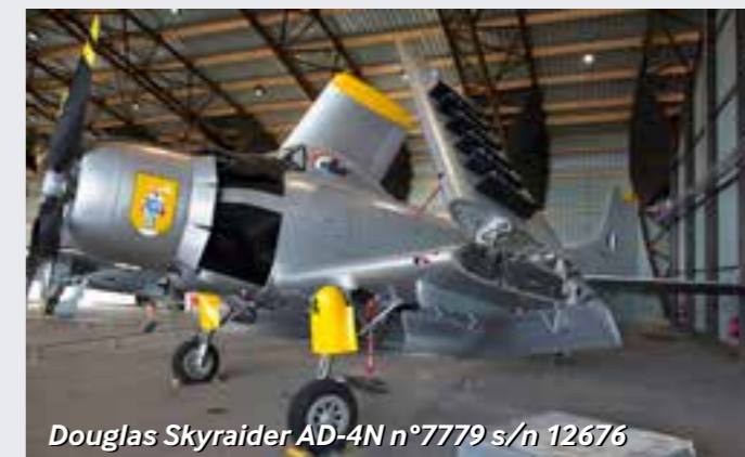
Douglas Skyraider AD-4N n°7779 s/n 12676

Décrire et expliquer les transformations de la matière Mouvement et interaction