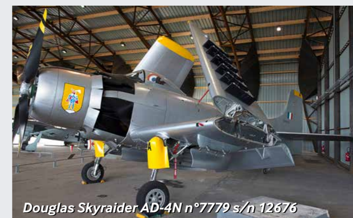
Douglas Skyraider AD-4N n°7779 s/n 12676

Décrire et expliquer les transformations de la matière Mouvement et interaction