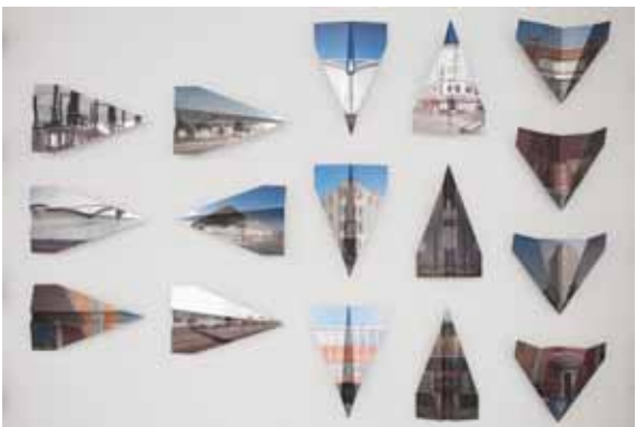
© Les EpouxP - Pascale & Damien Peyret - 2015

La maquette de soufflerie du biplan Farman «militaire» testée dans la soufflerie Eiffel en mars 1913, invite à la découverte des collections riches et éclectiques de maquettes du musée. Cet objet précieux et fragile avait une fonction scientifique importante puisqu'il a permis d'étudier en miniature la résistance de l'engin à l'air. Il fait écho à la série d' origami , photographies sur aluminium plié en forme d'avion. Cette installation fut créée en 2015 lors de la résidence d'artiste de Pascale & Damien Peyret à La Capsule du Bourget dans le cadre d'un partenariat entre le Conseil départemental de la Seine-Saint-Denis et la Ville du Bourget.