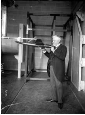
PR 73086

L'immersion dans les archives invite à faire sans cesse l'aller-retour entre le temps des images et le temps de leur lecture. Elle est une invitation à relire aujourd'hui des documents plus ou moins anciens. Pour illustrer cette distorsion du temps, Les EpouxP initient une collaboration avec les équipes de Saint-Louis en réactivant sous la forme de gifs les scènes photographiées il y a plus d'un siècle : les cheveux de Gustave Eiffel s'ébouriffent dans la soufflerie qu'il a créée, le Blériot XI traverse le ciel en un éclair, et des drapeaux s'agitent dans une acrobatie aérienne du Caudron C-128.