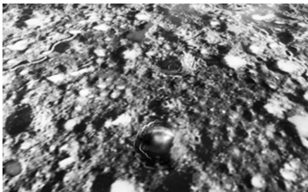
© Les EpouxP - Pascale & Damien Peyret - 2017 / source : bombardement ©D.R. / Coll. musée de l'Air et de l'Espace - Le Bourget

Cette installation totémique met en œuvre l'appareil photographique Gaumont usuellement embarqué sur les avions de renseignement français pendant la Première Guerre mondiale. L'appareil était installé par suspension pendulaire ou posé sur un cadre qui traversait le fuselage. On parle de position universelle. Sur le sol, perpendiculaire à celui-ci, un tirage photographique grand format d'un champ de bataille bombardé et photographié par ce même appareil. Cette vision désincarnée, distancée, opère un basculement du regard et tend le sujet vers une abstraction visuelle qui trouble la perception. Les artistes emboutissent le tirage photographique, des cratères se forment à la surface de l'image. Cette intervention sur la photographie d'archive est un puissant moyen pour démêler les fils de la mémoire et du souvenir.