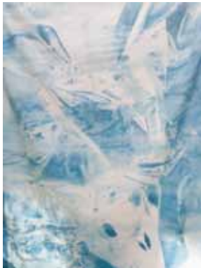
© Les EpouxP - Pascale & Damien Peyret - 2017

Cette installation présente une caisse à claire-voie contenant un élément du Lockheed P-38 Lightning , vestige de l'avion du commandant Antoine de Saint-Exupéry abattu en 1944 et retrouvé en 2000 au large de Marseille. Le spectateur est invité à découvrir cette relique en plongeant son regard entre les lames de bois de la caisse de stockage.