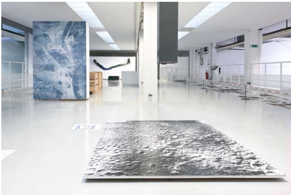
vue générale de l'exposition Latitude 48.9333

Le regard circule d'une métaphore à une autre : photographies en volume, dispositifs photographiques, livres d'artistes, vidéos, gifs... Chacune des propositions opère une alchimie visuelle et offre une lecture contemporaine des collections, des archives et des lieux patrimoniaux. Avec ces mises en espace et ces manipulations sur les objets photographiques, les EpouxP délivrent une vision singulière de notre désir de mémoire et de notre aptitude à rêver.