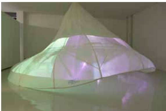
© Les EpouxP - Pascale & Damien Peyret - 2015

Un poumon de toile respire aux rythmes des flux de la ville. Elaborée à partir d'un parachute de soie, cette installation inspire, expire et s'anime de vidéos captées sur les axes qui traversent le bassin du Bourget. Elle préfigure le territoire aéroportuaire semblable à un poumon irrigué par ces flux. Mis en œuvre à l'aide d'une soufflerie, le textile s'emplit d'air et la toile fait office d'écran alors qu'un dispositif simple de réflexion lumineuse (selon le principe du fantôme de Pepper) décompose l'image animée et semble accélérer les flux.