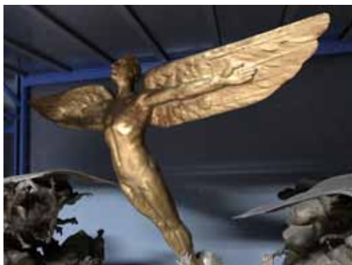
Statue d'Icare - collection du musée de l'Air et de l'Espace N°11012

Placé sous la tutelle du Ministère de la Défense et bénéficiant du label « Musée de France, » le musée de l'Air et de l'Espace remplit des missions essentielles de service public dans les domaines de la culture, du patrimoine et de l'éducation :