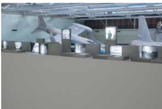
© Les EpouxP - Pascale & Damien Peyret - 2017

Installation de 16 boîtes d'archivage en métal destinées à la conservation des plaques photographiques en verre de format 13x18. A l'usage, la forme gigogne des boîtes a révélé un risque de bris des plaques de verre lors de leur manipulation. Il existe aussi un doute sur l'altération de certaines photographies, probablement due à l'échange chimique entre le métal des boîtes et le bromure d'argent des plaques photographiques. Avec l'aide des documentalistes du musée, les artistes exposent leur recherche de plaques de verres altérées par la main de l'homme : plaques brisées, couches argentiques abîmées, détournages à la gouache... Leurs reproductions photographiques sont présentées sous forme de boîtes lumineuses. Certaines sont équipées d'un trait de lumière qui balaye la photographie comme un scanner. Une manière de rappeler la tâche immense de conserver et scanner les 65 000 plaques argentiques des collections du musée de l'Air et de l'Espace.