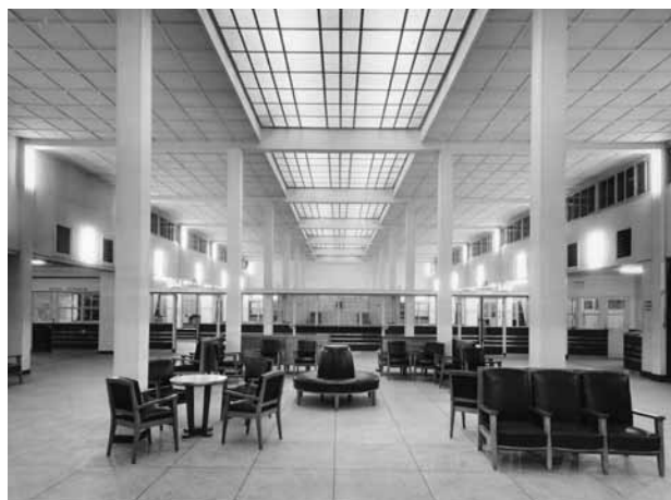
© D.R./ musée de l'Air et de l'Espace - Le Bourget MA 21893

Le site du Bourget est profondément lié à l'histoire de l'aviation. Depuis son utilisation par les forces aériennes de la Grande Guerre, il a vu atterrir les plus illustres pionniers des airs, parmi lesquels l'aviateur Charles Lindbergh.