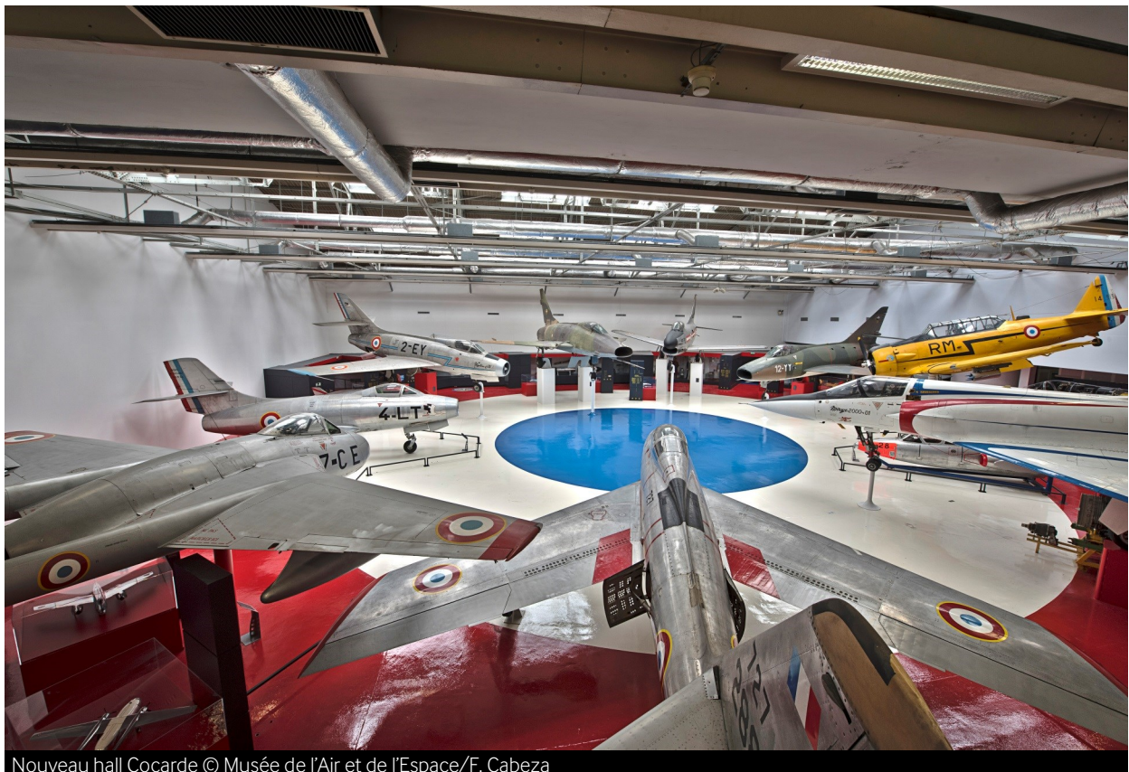
Nouveau hall Cocarde