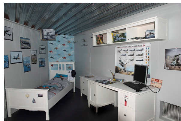
Nouveau hall Cocarde