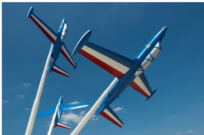
Fouga CM-170 Magister de la Patrouille de France, restaurés en 2013

Depuis septembre 2010, le musée de l'Air et de l'Espace est piloté par Catherine Maunoury, double championne du monde de voltige aérienne.