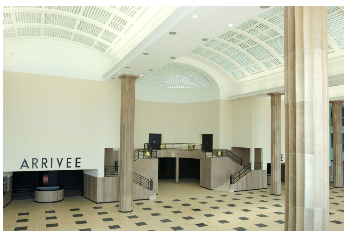
Hall des Huit Colonnes restauré en 2013