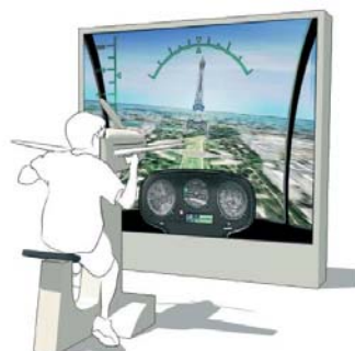
Simulateur de vol

C'est une nouvelle offre éducative et de loisir, un moment ludique pour les publics scolaires, parascolaires et familiaux.